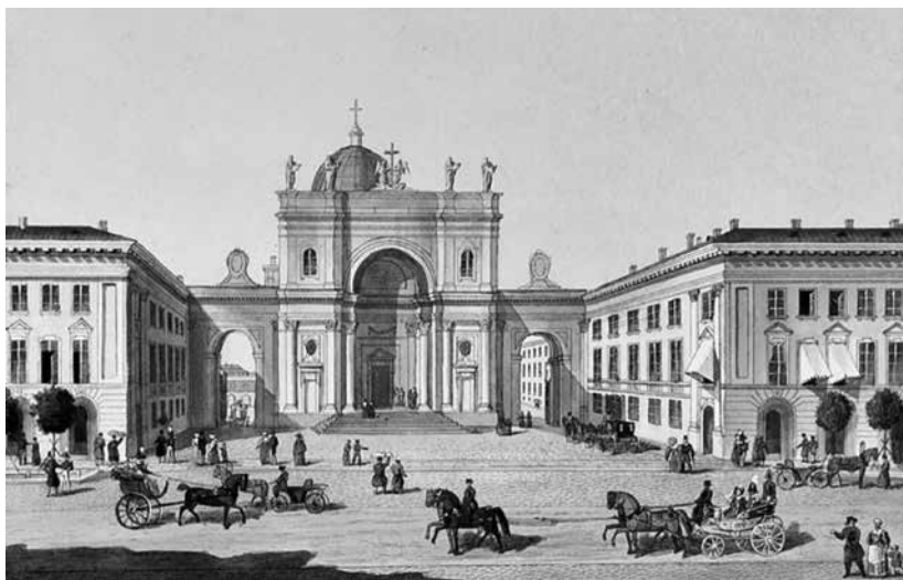
San Petersburgo comienzo s. XIX. Iglesia católica Santa Ekaterina de Alejandría